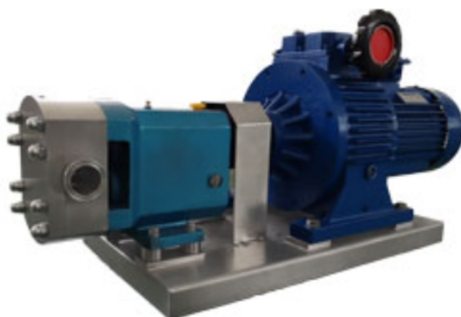
上海莱敦机械设备有限公司 转子泵专业制造商

对于输送含油量高流动性较好的馅料可以选择水平进出的不锈钢 转子泵 。如果要输送含油量低流动性差的馅料，只有选用特殊的不锈钢 转子泵 。首先，进出料方向只能选择上进下出，而且进料口口径要尽可能大，使得馅料靠本身的重量和不锈钢 转子泵 运转时产生的微量负压进入 转子泵 泵腔内，这样不锈钢 转子泵 就会将馅料输送出去。输送馅料用的特殊 转子泵 -上海莱敦馅料泵用什么样的进料口较为合适，按照不锈钢 转子泵 的不同规格，将进料口做成与转子室想匹配的方形料口。不锈钢转子泵输送冰淇淋料。国产不锈钢转子泵价格