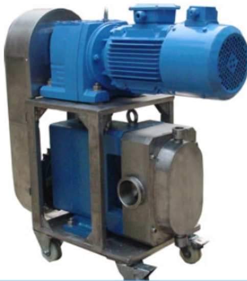
上海莱敦机械设备有限公司 转子泵专业制造商

蝶形转子泵： 不锈钢 转子泵 的转子形状就像蝴蝶的一对翅膀，故称它为蝶形转子。这类不锈钢 转子泵 具有输送含有软性颗粒（如果肉等）的物料（如果肉等）的能力，同时在输送过程中对物料中含有的软性颗粒具有一定的保护作用，但对软性颗粒仍有一定的破损率。由于蝶形转子没有重心偏移的情况，可以在比较高的转速下运行，流量和扬程也可以比较高，使用范围比较广。另外还有一种不锈钢 转子泵 转子的形状类似于斧头形状，我们称之它为单蝶形 转子泵 。这类不锈钢 转子泵 可以输送含有粒径较大的软性颗粒（如草莓，葡萄等）的物料，输送过程中这些软性颗粒的破损率较小。由于单蝶形转子的重心不在回转中心，故不适合高转速运转。